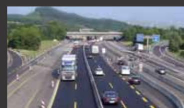
A 6 Autobahnkreuz Weinsberg ■ Örtliche Bauüberwachung