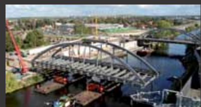
A 113, Berlin - Stabbogenbrücke Teltowkanal

■ Objektplanung Ingenieurbauwerke, Tragwerksplanung, Örtliche Bauüberwachung, Bauoberleitung