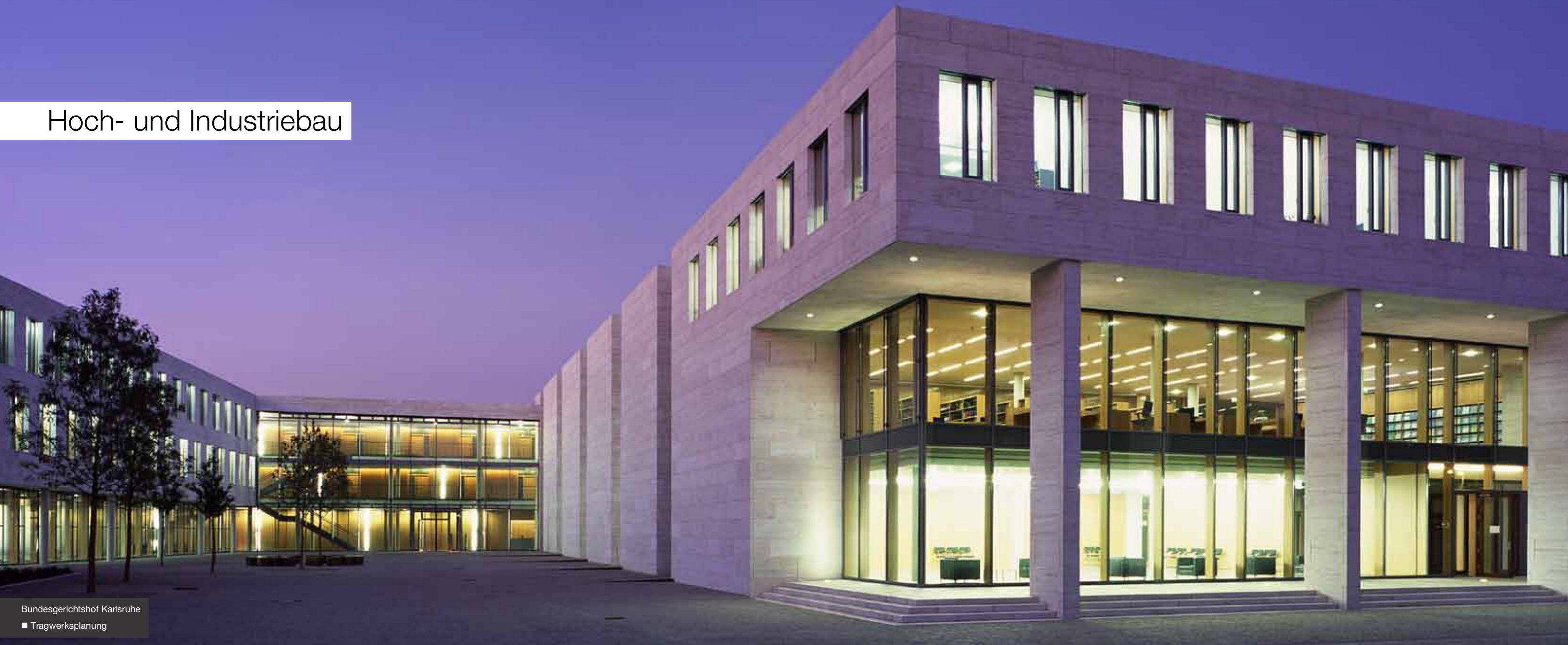
Bundesgerichtshof Karlsruhe ■ Tragwerksplanung