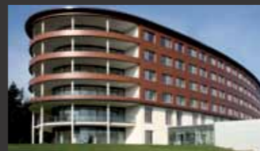
Wald-Klinikum Gera ■ Tragwerksplanung