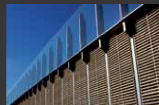
A 113, Berlin Lärmschutzwand Johannisthaler Chaussee

■ Objektplanung Ingenieurbauwerke, Tragwerksplanung, Planprüfung