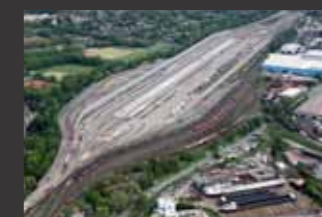
Neubau Zugbildungsanlage und Neubau KV-Drehscheibe im Bahnhof Duisburg-Ruhrort Hafen ■ Projektsteuerung, Stofflogistik