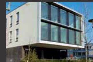
Bürogebäude München ■ Statisch-konstruktive Prüfung