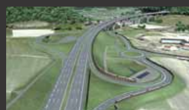
A 8 Karlsruhe-München ■ Objektplanung Verkehrsanlagen