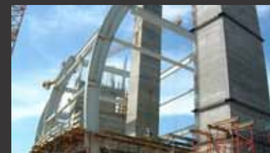
Hockenheimring Südtribüne ■ Tragwerksplanung