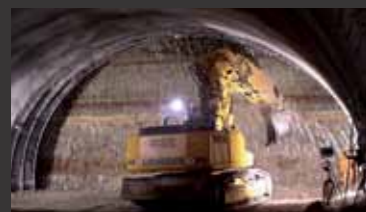
Jagdbergtunnel ■ Bauoberleitung, Örtliche Bauüberwachung, Bauvermessung

In der Tunnelsicherheit sind wir in folgenden Bereichen tätig: Sicherheitsgutachten | Risikoanalysen | Gesamtsicherheitskonzepte | Alarm- und Gefahrenanalysen