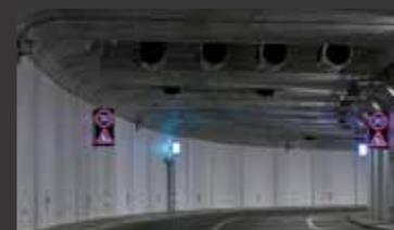
Tiergartentunnel, Berlin ■ Sicherheitskonzept