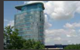
Fachhochschule Heidelberg ■ Tragwerksplanung