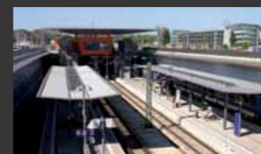
Generalplanung „Neu-Ulm 21“ ■ Objektplanung Verkehrsanlagen, Tragwerksplanung, Technische Ausrüstung