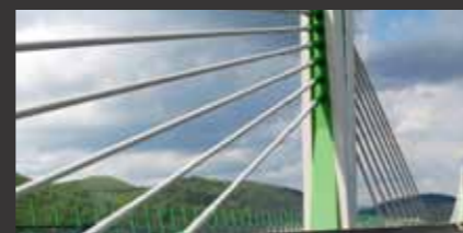
D1 Motorway Sverepec Slowakei

■ Objektplanung Ingenieurbauwerke, Tragwerksplanung, Planprüfung