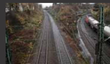
ABS/NBS Karlsruhe - Basel ■ Objektplanung Verkehrsanlagen