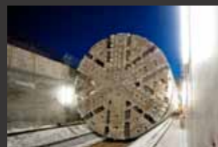
Finnetunnel ■ Bauoberleitung, Örtliche Bauüberwachung