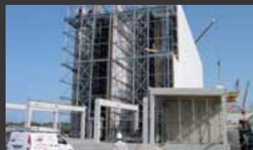
Hochregallager Alpenhain ■ Statisch-konstruktive Prüfung