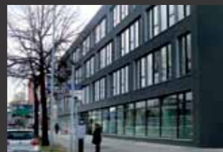
Nordhoffstraße Wolfsburg ■ Immobilienbewertung