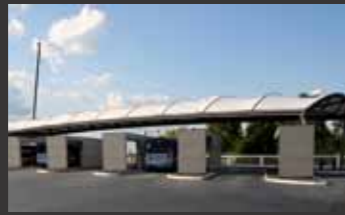
Neuer Busbahnhof Wiesloch-Walldorf ■ Tragwerksplanung