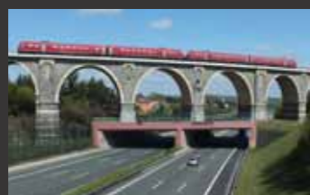
A 4 Chemnitz-Nossen ■ Objektplanung Verkehrsanlagen