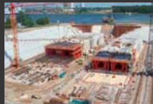
Einschwimm- und Absenktunnel Warnowquerung Rostock ■ Objektplanung Ingenieurbauwerke, Tragwerksplanung, Technische Ausstattung, Geotechnische Beratung