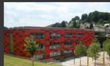
Schulzentrum Neckargemünd ■ Tragwerksplanung