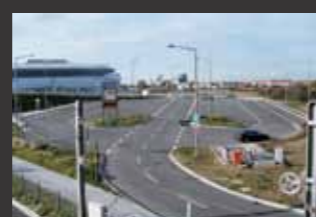
Erschließung SAP Arena Mannheim ■ Objektplanung Verkehrsanlagen