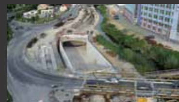
Straßentunnel Schwäbisch Gmünd ■ Objektplanung Ingenieurbauwerke, Tragwerksplanung, Technische Ausstattung, Bauüberwachung und Bauoberleitung, Sicherheitsbeauftragter nach RABT