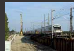
Ausbaustrecke Augsburg-Olching ■ Örtliche Bauüberwachung